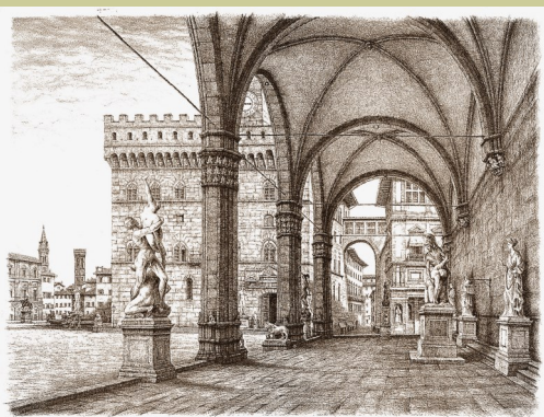
Un'acquaforte della Loggia dei Lanzi a Firenze